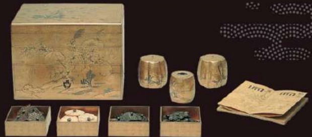
「梨地裏吾山吹十種香箱」