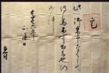
「伝馬朱印状」(成瀬家文書)